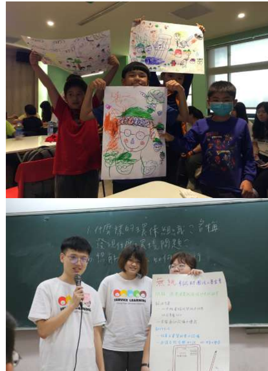
▲（上）小朋友透過繪畫分享淨山心得。 （下）志工們分組成立環境組織，提出環境問題並討論解決方法。

「除了攝影什麼都不取，除了足跡什麼都不留。」就算帶著大批隊伍進入山林，種籽團對於環保的細節一點也不馬虎，任何有可能會造成垃圾的舉動，都以更加環保的方法作為替代，堅守著帶什麼上山，就帶什麼下山的信念，他們正一步一腳印地，透過行動給我們的環境帶來更永續的承諾。