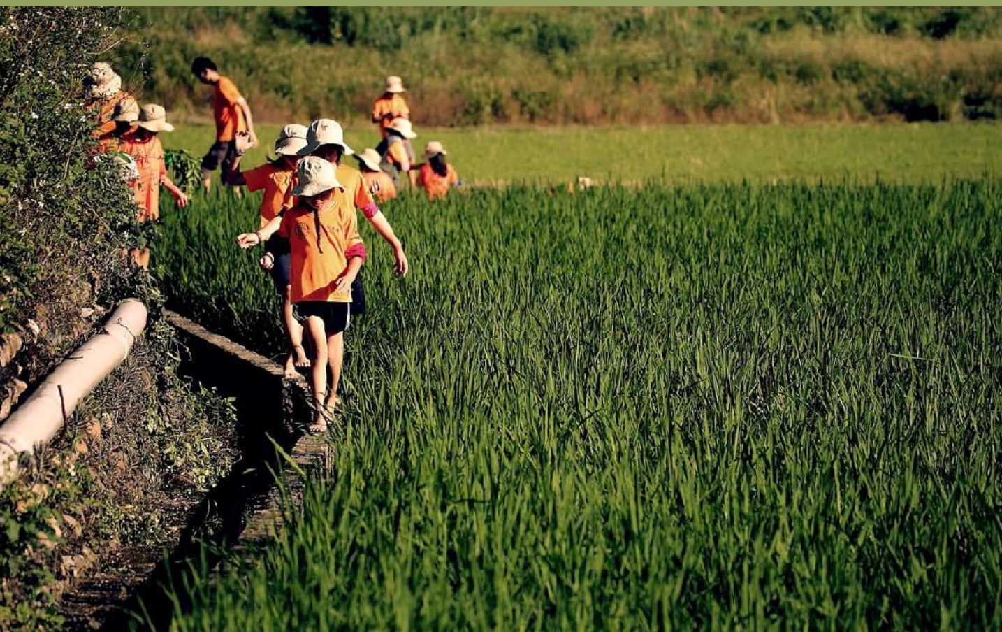
田間的親子團夥伴們。

為了增加在地居民們的認同感，更為環境著想，協會以調查問卷邀請大家為自己居住地的公園進行生態化評估，增加民眾對家鄉的瞭解，更可以讓我們開始以動物的觀點思考。這些資料也將提供給公部門當作參考，期許打造出讓彼此共存的綠色空間。協會舉辦這些活動，除了增進公民參與度、推廣環境教育之外，更希望能成為民意的平台，成為一個指標。