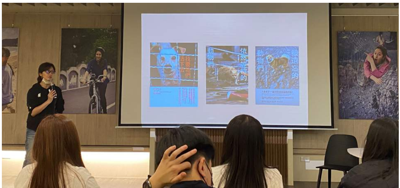
▲ 學生到場聆聽十二夜導演的演講。