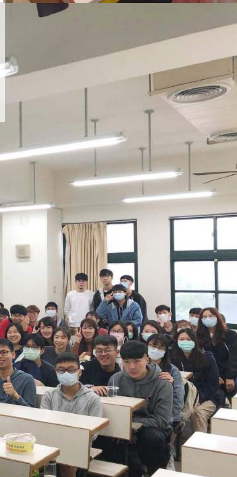
卓老師與資管一甲全體學生。