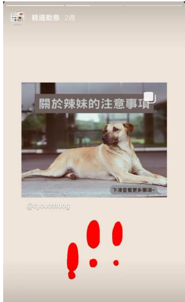
▲ 學生協助分享動服社的資訊，讓大家更注意到動保議題。

這群同學們樂意踏出教室，從服務學習中吸收新的觀點，擴展自己的視野。這次透過他們的服務經驗，深入瞭解了目前動保的情況，希望未來結紮的觀念能慢慢成為常識，集合大家的力量，一起改善浪浪們現在的處境。