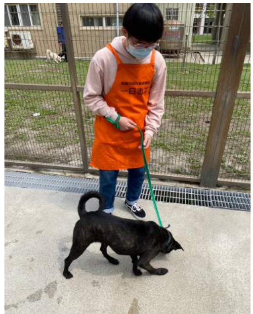
學生至桃園市動物保護教育園區擔任一日志工，協助訓練狗狗。

另外，對於動物保護領域影響很大的一部電影—十二夜，內容主要描述收容所裡的狗狗們若經過十二天都沒有被領養，就會以安樂死的方式處理。這部電影發布之後引起很大的迴響及反彈，政府也因此實施了零安樂死的政策。不過零安樂死若沒做好配套措施，將會引起更大的問題出現。因此導演拍了續集，直擊收容所內動物暴增的情形。第三組同學以此為契機，去聽了導演製片的心路歷程，並瞭解若要徹底解決流浪動物的問題，不能只有片面的政策，還需要完善的配套措施，以及大眾正確的動保觀念，才能有效解決這個問題。