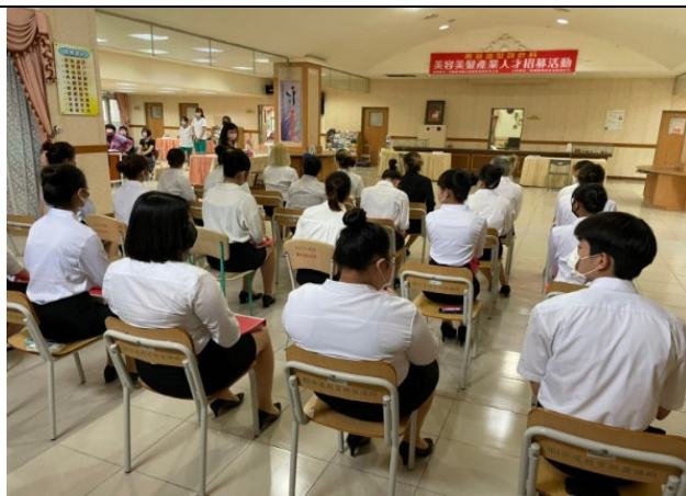
照片說明：同學等待面試情形