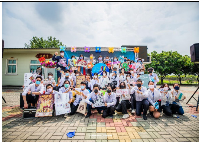
照片說明：與會活動的準畢業生，在活動結束後拍攝大合照。