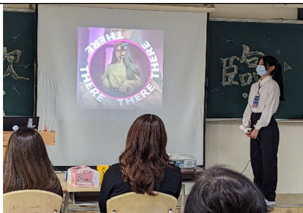
照片說明：面試同學以“影片剪輯”創新的手法展現專長，介紹自己。