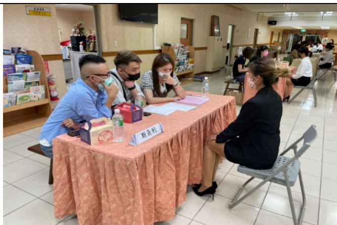
照片說明：企業單位面試情形