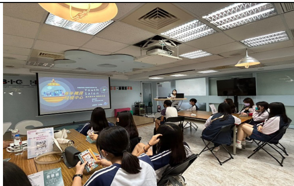
說明:講師零距離與同學互動