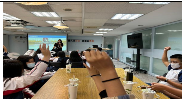
說明:講師說明長照 2.0 政策