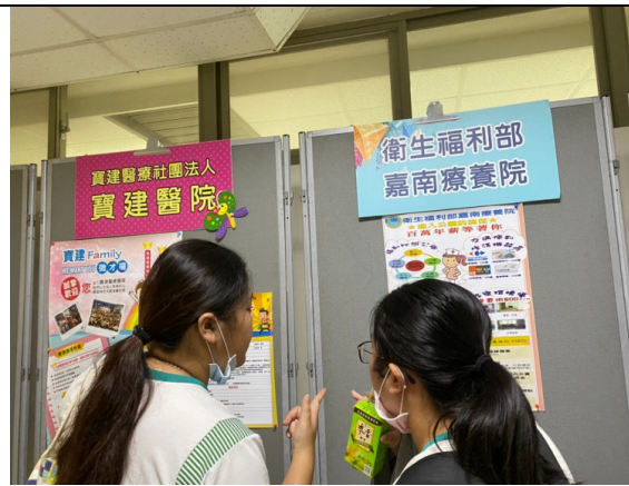
說明：慈惠醫專 2020 線上(靜態)就業博覽會