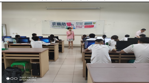
說明：勞工局求職防騙宣導