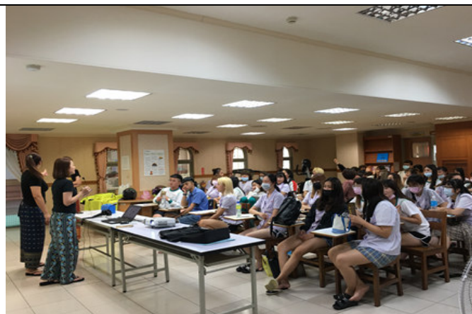
說明:美容造型設計科職涯講座-校友職涯經驗分享