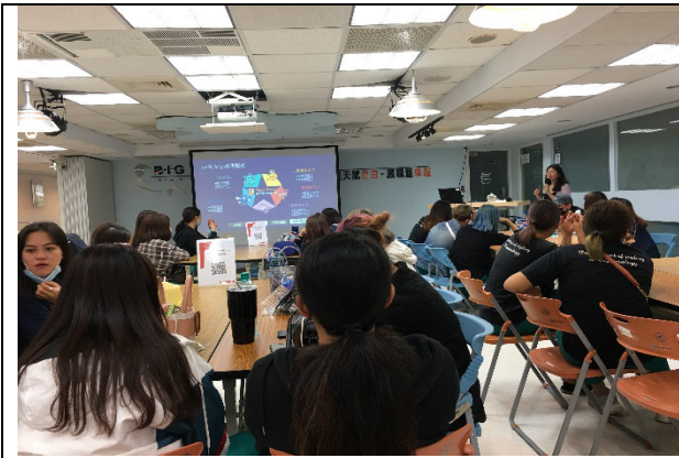
說明：美容造型設計科產業職場參訪體驗-YS