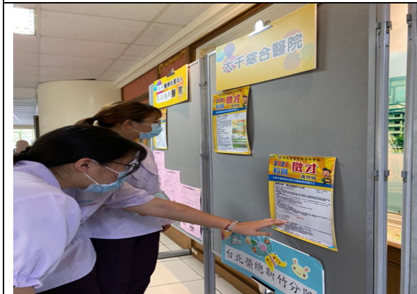
說明：慈惠醫專 2020 線上(靜態)就業博覽會