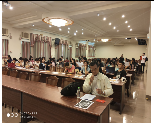
說明：108 年度大專校院勞動權益座談巡迴活動