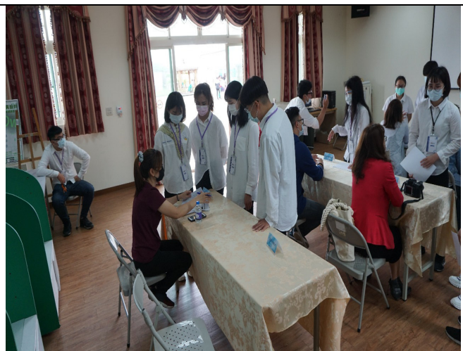
說明：慈惠醫專2020設計職群招募活動