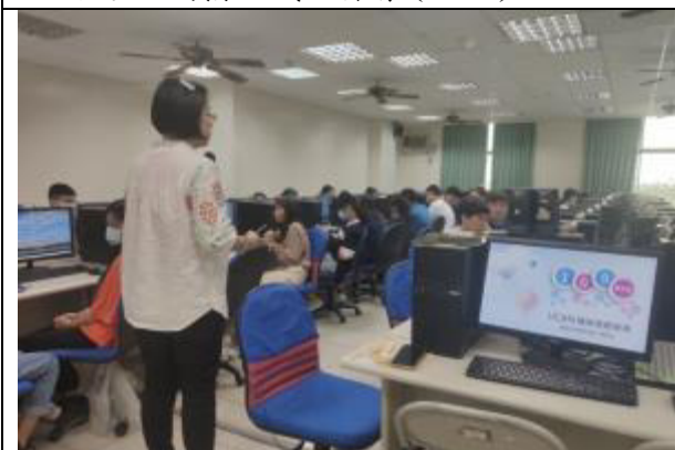
說明：生涯領航-職涯探索(UCAN)