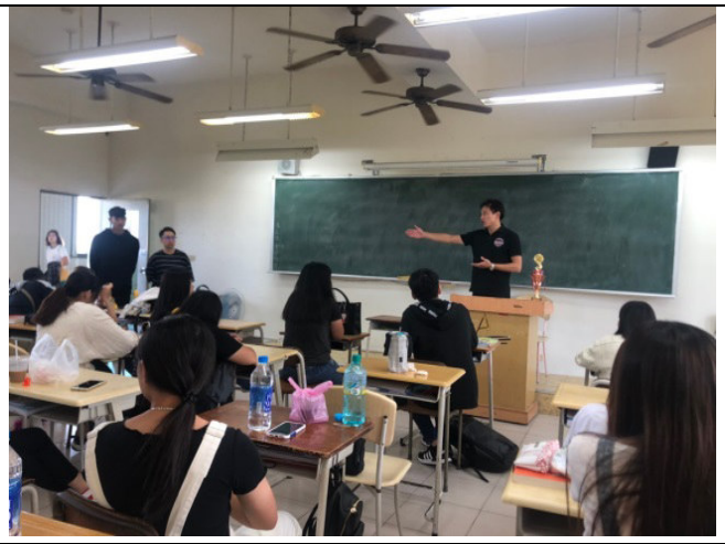
說明：觀光服務就業職場參訪體驗-於校內進行職場人際課程