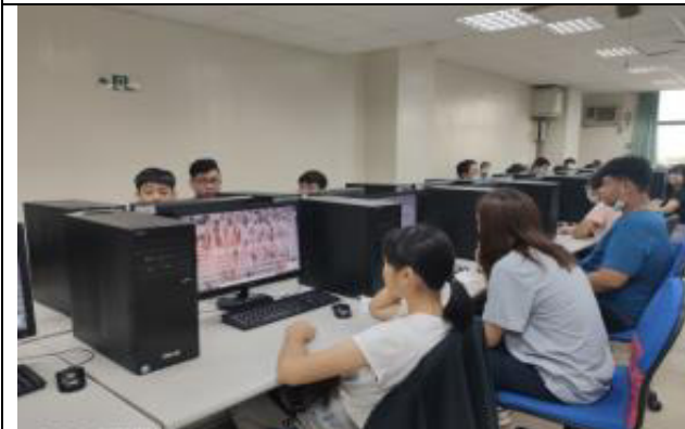
說明：生涯領航-職涯探索(UCAN)