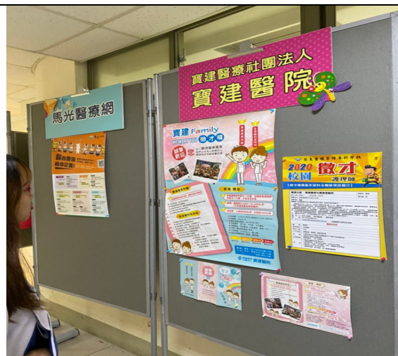
說明：慈惠醫專 2020 線上(靜態)就業博覽會