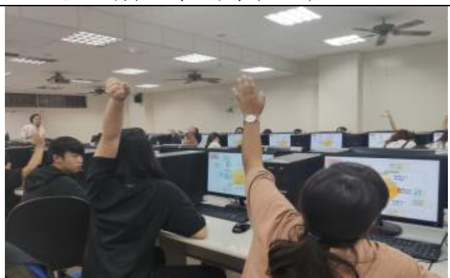
說明：生涯領航-職涯探索(UCAN)