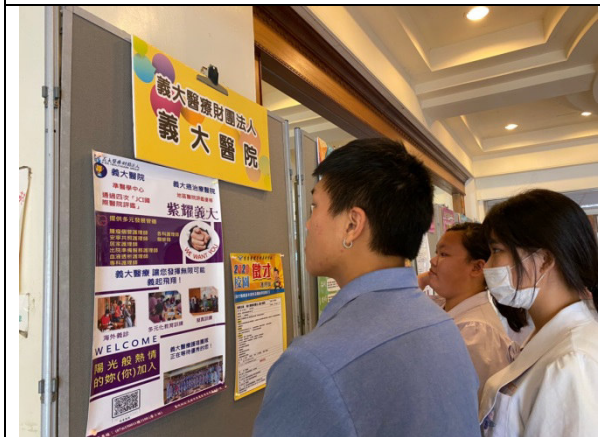
說明：慈惠醫專 2020 線上(靜態)就業博覽會