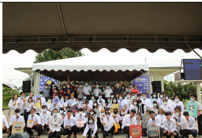
說明:慈惠醫專 2020 設計職群招募活動