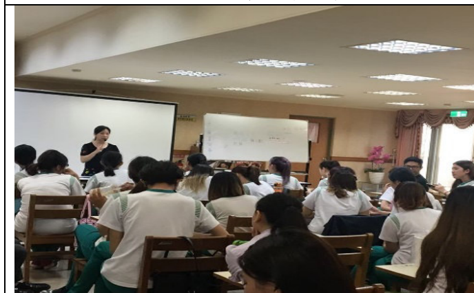
說明:美容造型設計科職涯講座-介紹 YS 職涯中心