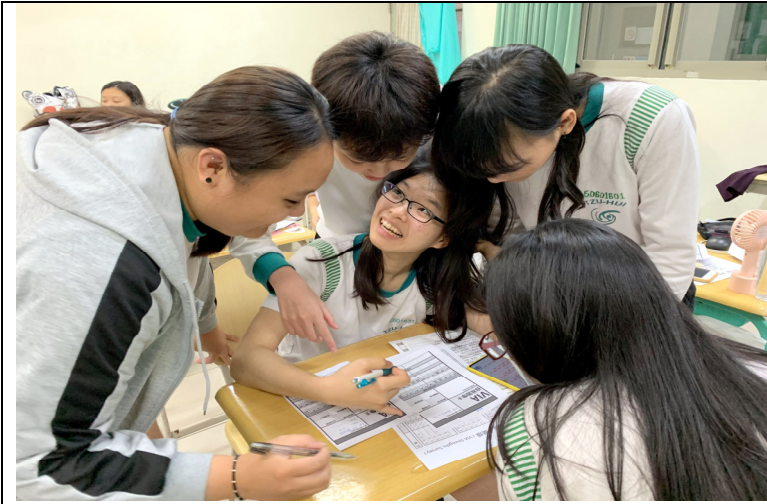
說明：青發署計畫-遇見未來的自己-護理職涯多元探索計畫