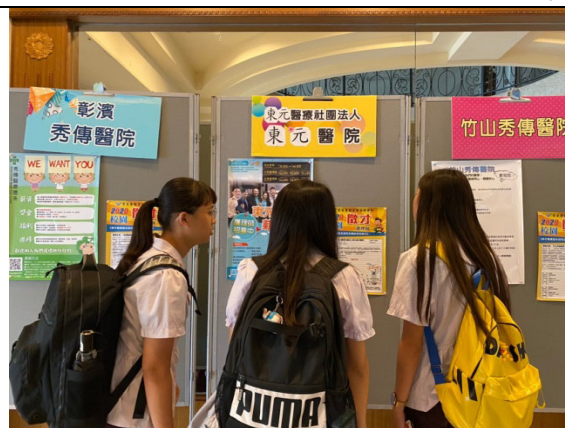
說明：慈惠醫專 2020 線上(靜態)就業博覽會