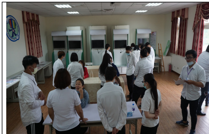
說明:慈惠醫專 2020 設計職群招募活動