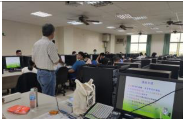
說明：生涯領航-職涯探索(UCAN)