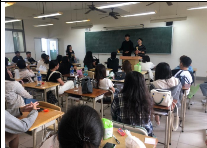
說明：觀光服務就業職場參訪體驗-於校內進行職場倫理課程