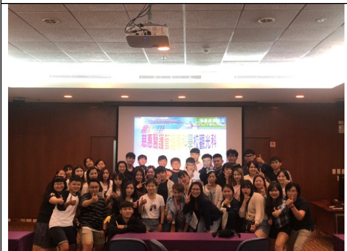
說明：說明：觀光服務就業職場參訪體驗-福華