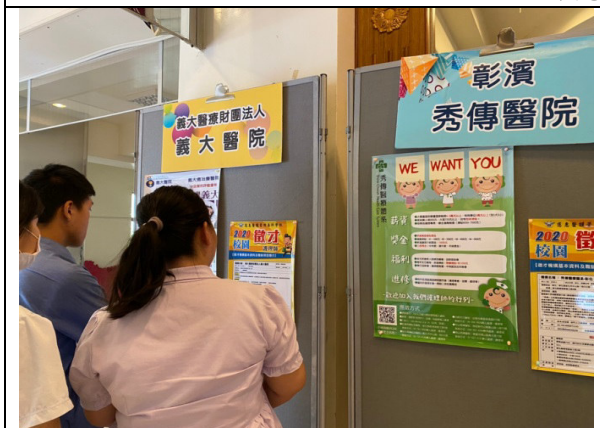
說明：慈惠醫專 2020 線上(靜態)就業博覽會