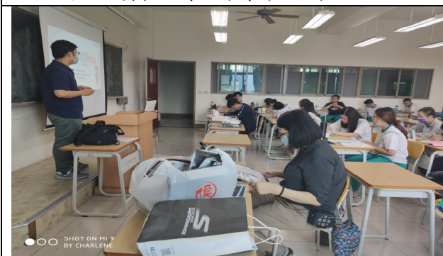
說明：勞工局求職防騙宣導