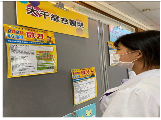
說明：慈惠醫專 2020 線上(靜態)就業博覽會