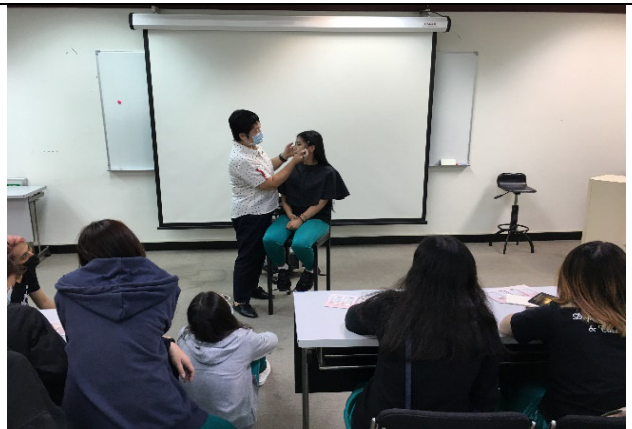
說明：美容造型設計科產業職場參訪體驗